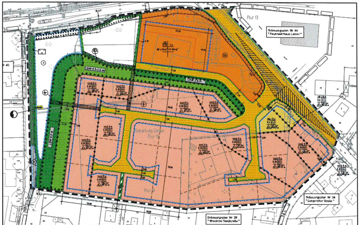
Bebauungsplan Nr. 49 „Südlich Lengericher Straße“ – 1. Änderung